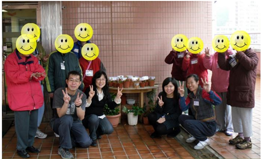
園藝治療活動留影 [前排:實習生(左二)與助理團隊，後排：服務對象]

要成為園藝治療服務員，通常要參與 8 個小組，經過許多月以至年的時間。對於忙碌的香港人來說，這要求並不簡單，但也十分之值得。首先，如果用心觀察和記憶，多發問請益，每可以從當實習生的師兄姐身上學到帶領不同對象的技巧和竅門，和各種園藝活